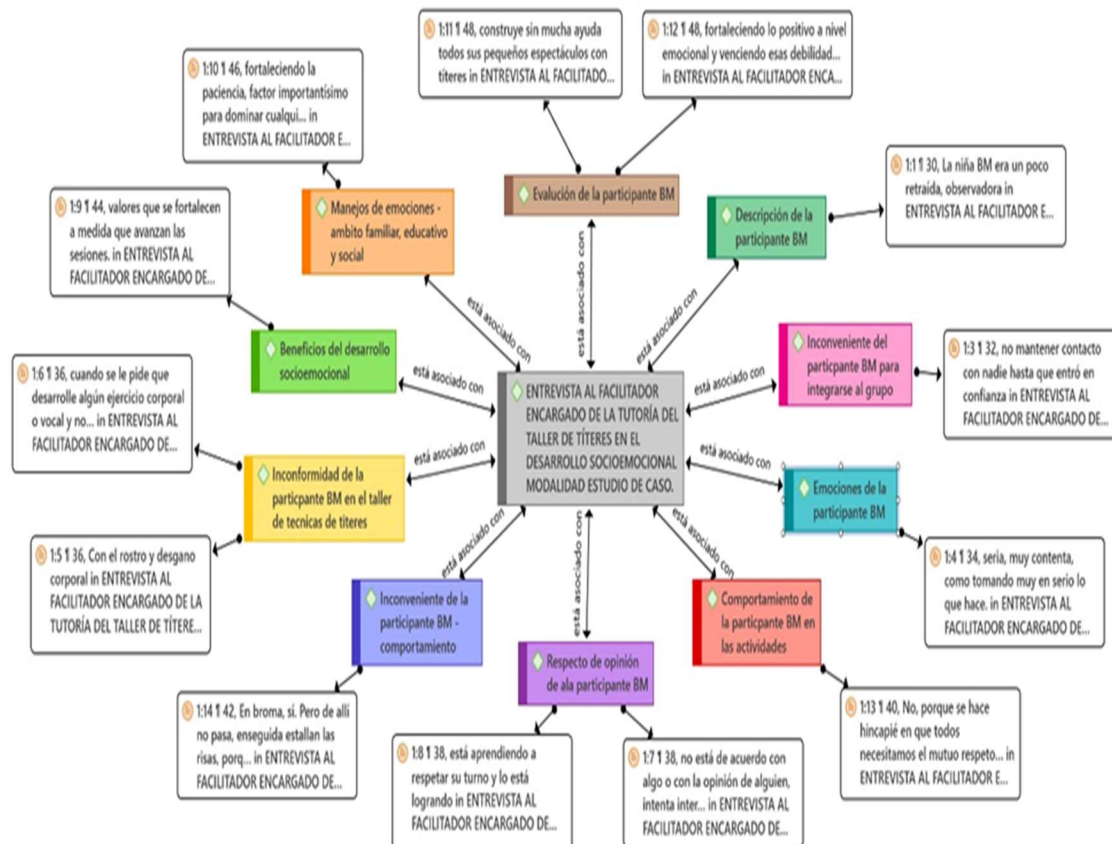
Figura 2 Red semántica: Entrevista al docente facilitador