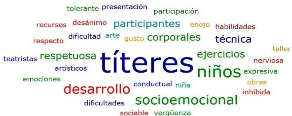
Figura 3 Nube de palabras: Ficha de cotejo de observación