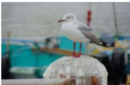
Fig. 3. Gaviota Cabecigris.