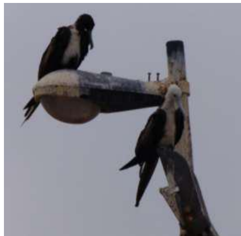
Fig. 1. Fregata magnificens macho juvenil I (derecho inferior) y macho juvenil II (izquierda superior).

En la figura 1 se observa dos fragatas machos en los grados de madurez I y II, la primera juvenil por su cabeza y pecho blanco (derecho inferior) y la segunda en etapa de maduración por su cabeza negra y pecho blanco. Ambas con la coloración del iris negro.