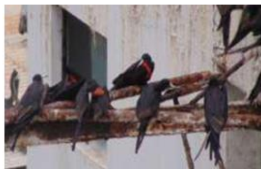
Fig. 2. Agrupación de Fragatas

En la Fig. 2 se aprecia una agrupación de fragatas que después de realizar el forrajeo descansan sobre el tejado de algunas construcciones; se observan 3 aves con la membrana roja, es decir, son machos maduros clasificados en el grado III (Tabla 2).