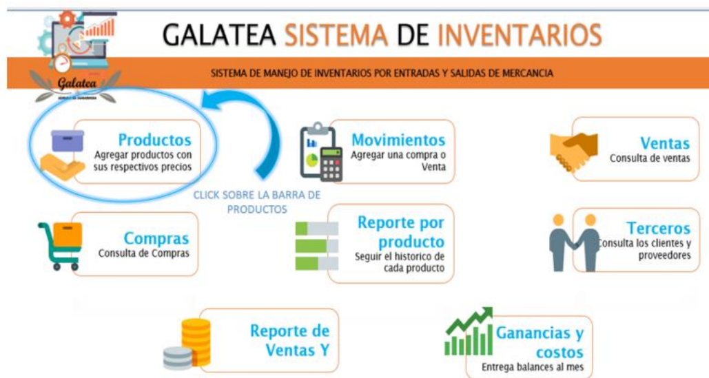
Sistema de Inventarios GALATEA