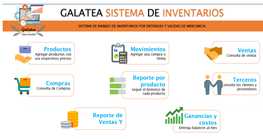
Imágen 1 Sistema de Inventarios GALATEA

“Galatea Sistema de inventarios” es un programa funcional para las pymes y MiPymes con la ayudada para los inventarios esto con la verificación a nivel nacional de empresas que han adquirido dicho sistema para sus organizaciones.