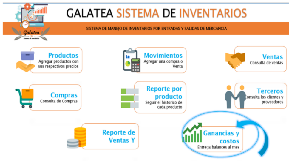
Imágen 7 Sistema de Inventarios GALATEA

Información financiera del costo o la ganancia de la entidad donde permite generarlas sin ningún problema